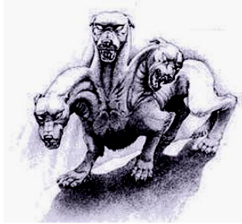
Zerberus, ein dreiköpfiger Hund, bewacht die Unterwelt