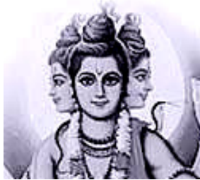
Trimurti, eine indische Götter-Triade

Die Dreieinigkeit „Gott Vater“, „Gott Sohn“, „Gott Heiliger Geist“