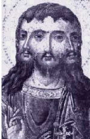
Trinität auf einer alten Darstellung

Die Dreieinigkeit „Gott Vater“, „Gott Sohn“, „Gott Heiliger Geist“